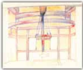
【無藝荘の囲炉裏—小津スケッチ帳より】 両角昭雄氏所蔵

小津安二郎 夢科の丸々たる貸し馬の腹吹抜けて秋の風吹く 小津安二郎 孫原亨氏所蔵